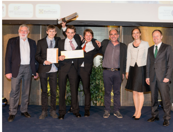
Projekt „RElectronics“ - Gewinner des Raiffeisen Sustainability Awards 2015/16