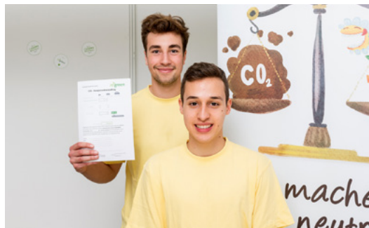
„ReGreen - mach's CO2-neutral!“ 3. Preis 2015/16